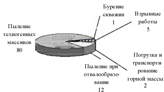
Рис. 2. Удельный вклад различных источников в выброс неорганической пыли при открытой разработке железорудных месторождений, %

Неорганическая пыль оказывает существенное влияние не только на химический состав атмосферы и метеорных вод, но и на растительные сообщества, в промышленных городах и особенно в непосредственной близости от источников загрязнения.