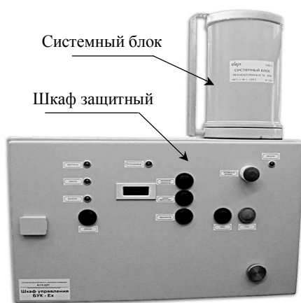
Рис.1. Внешний вид БУК-Ех